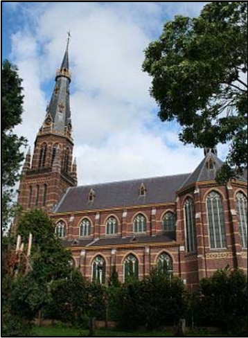
St. Clemenskerk (Baardwijk)