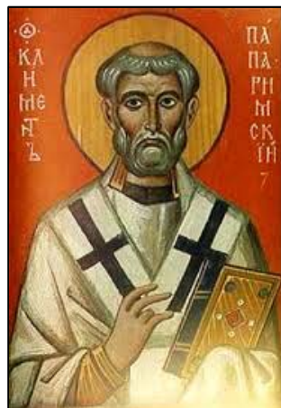
Paus Clemens I