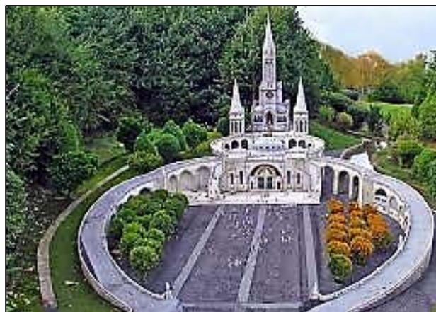
De Heiligdommen O.L.V. van Lourdes bedekken een oppervlakte van 52 hectaren waar u 22 kerken vindt. Foto: Rozenkransbasiliek

Er is voor deze reis een beperkt aantal plaatsen, dus wacht niet te lang met opgave als u graag mee wilt, want vol = vol.