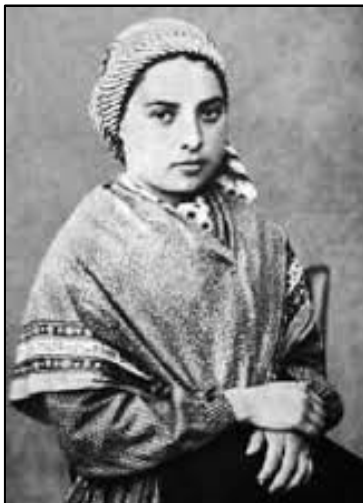
De heilige Bernadette Soubirous 1844 - 1879