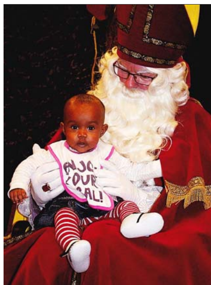
Sinterklaasfeest voor vluchtelingenkinderen

Toen in 1934 de katholieke verkennergroep in Waalwijk opgericht werd, moet het niet moeilijk zijn geweest voor de oprichtingscommissie een naam te vinden.