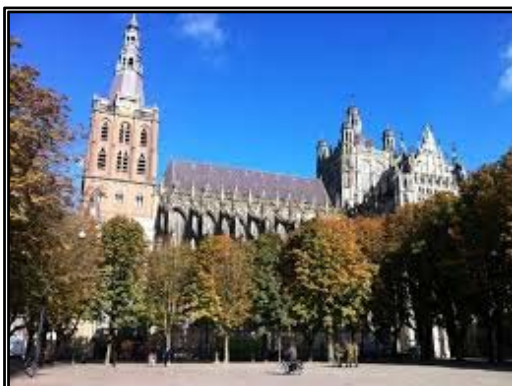
Sint-Jan - 's Hertogenbosch

Door kunstenaars bij het ontwerp van de stal te betrekken, wil het kerkbestuur nieuwe vormen zoeken om de dialoog aan te gaan. Volgens het bestuur heeft het verhaal van de geboorte van Jezus ook vandaag de dag betekenis, maar moet het wel op een verstaanbare manier worden vertaald. Kunstenaars zijn in staat om die vertaling te maken.