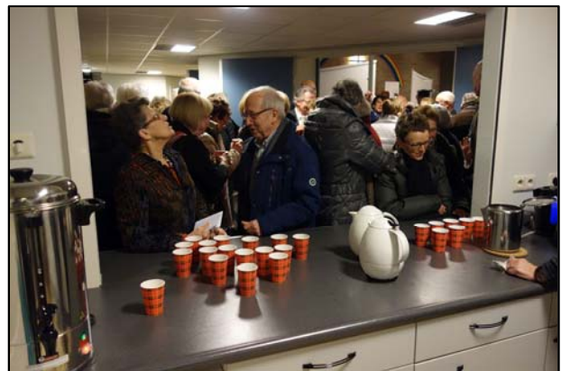
Koffie/thee na afloop