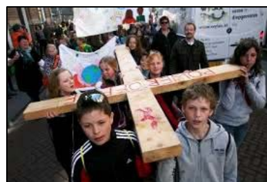
Power of Fire vormelingsdag 2014

Een ander onderdeel van de voorbereiding is deelname aan de Power of Fire vormelingsdag op zaterdag 15 april a.s. Deze dag wordt gehouden in Den Bosch. De Power of Fire-dag is een leuke dag die vol staat van ontmoeting met leeftijdsgenoten die gevormd zijn of zullen worden, van gebed, sport en spel, plezier en catechese.