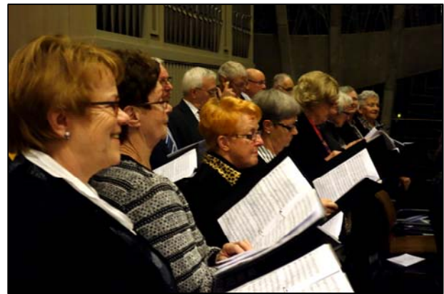
Het zingen van de mis vraagt om uiterste concentratie.