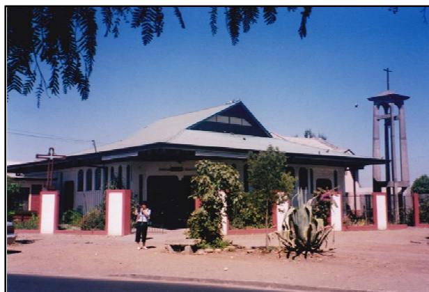
Parochiekerk Cristo Resucitado in Curicó (Chili)