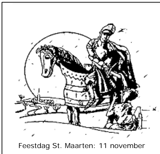
Feestdag St. Maarten: 11 november

In oktober zijn we weer gestart met de gezinsvieringen. Om goed mee te kunnen vieren en zingen zijn er aparte boekjes voor deze vieringen. Omdat we de liedjes bij de voorbereidingen op de Eerste H. Communie ook gebruiken, zijn ze herkenbaar voor de kinderen en makkelijk mee te zingen. Ging het in oktober over St. Franciscus, de dieren en de natuur, op zondag 8 november gaat het over St. Maarten. We hopen weer veel gezinnen met kinderen, opa's en oma's te ontmoeten. Niet vergeten dus! Zondag 8 november om 11.00 uur in de St. Clemenskerk.