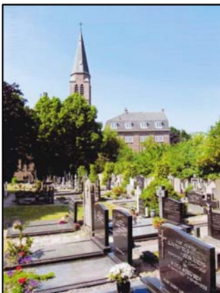
Begraafplaats St. Theresia