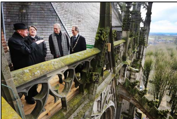
Zicht op het Bossche Bisdom vanaf de kathedraal

'Confidens in Christo' 'In vertrouwen op Christus'