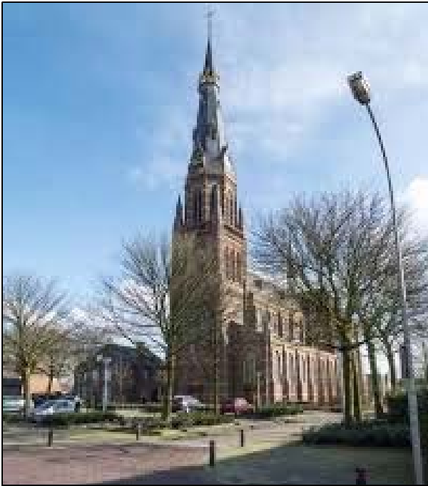
Architect: N.J.H. Groenendaal Ingebruikname kerk: 1 augustus 1897

Het bestuur van de parochie Sint Jan de Doper te Waalwijk heeft moeten besluiten de St.-Clemenskerk in Baardwijk vooralsnog een kapelstatus te geven. Het parochiebestuur gaat actief zoeken naar een passende herbestemming.